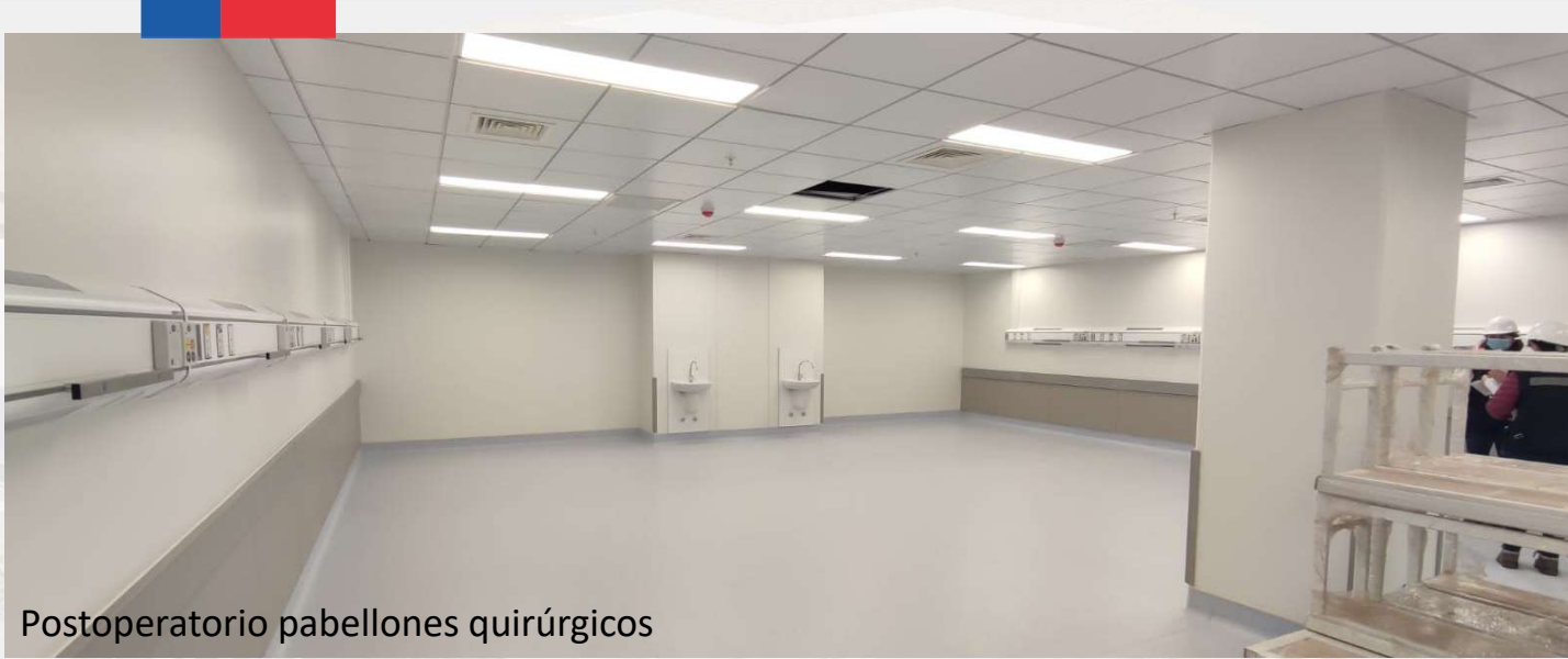
Postoperatorio pabellones quirúrgicos