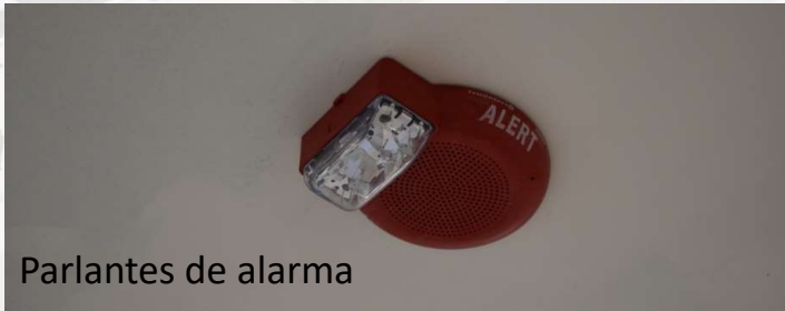
Parlantes de alarma