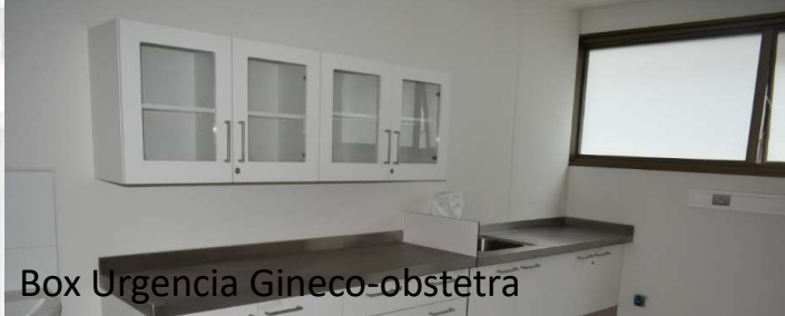
Box Urgencia Gineco-obstetra