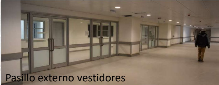
Pasillo externo vestidores