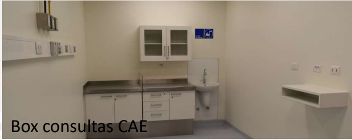
Box consultas CAE