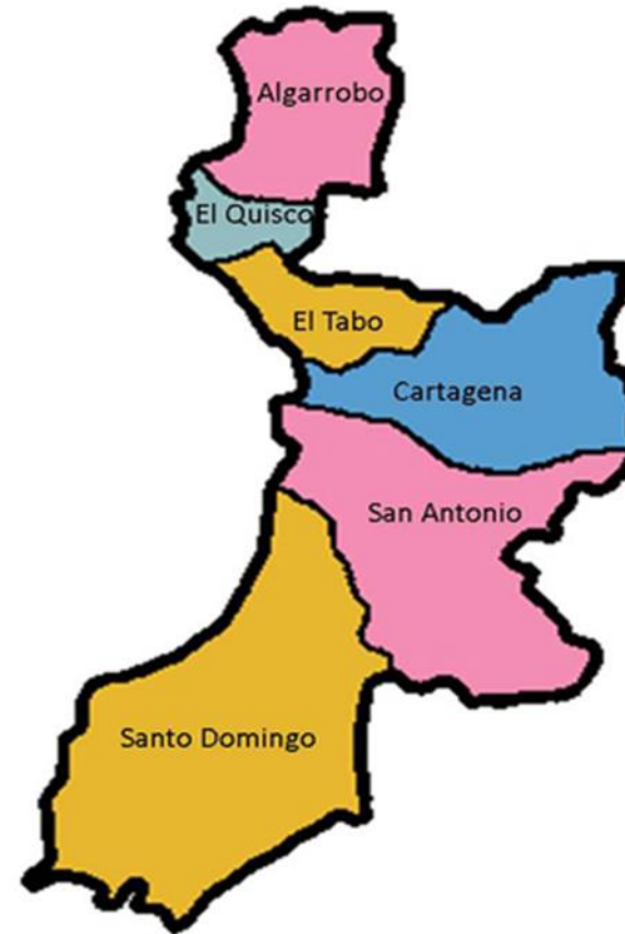
Comunas de la provincia de San Antonio