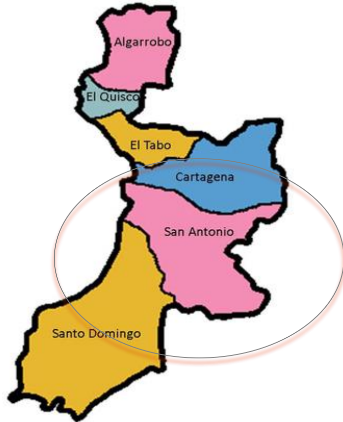
Comunas de la provincia de San Antonio